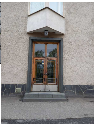
Aukion kiveys ja kalustemateriaalit toistavat viereisen rakennuksen sävyjä