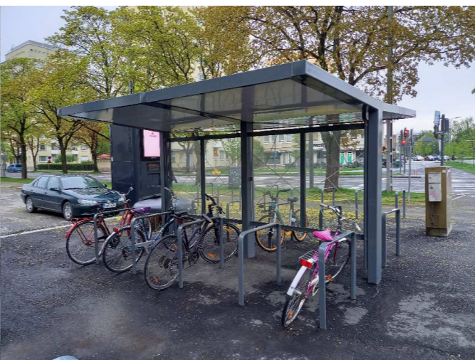
Säilytettävä pyöräkatos ja aukiota kadun puolella rajaava säilytettävä puuriivi