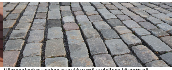
Hämeenkadun vanhaa nupukiveystä uudelleen käytettynä